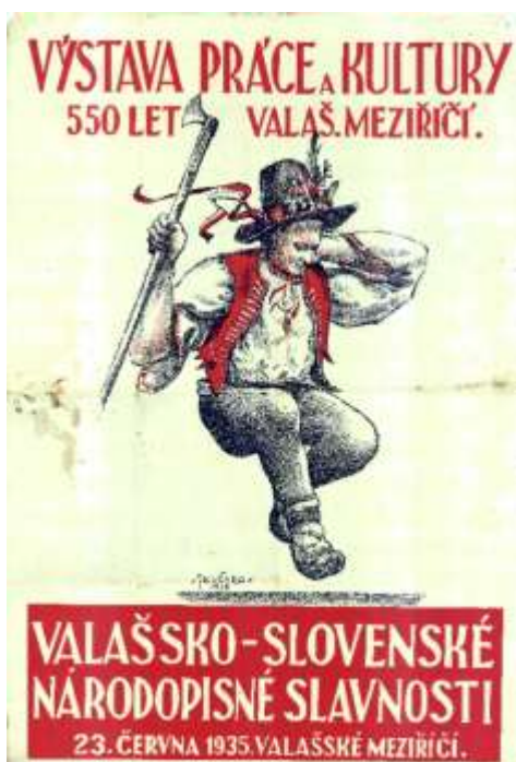
Obrázek 24: Plakát informující o Valaško-slovenských národních slavnostech

Na závěr zazněla hymna v podání 40. pěšího pluku a výstava mohla začít. 102