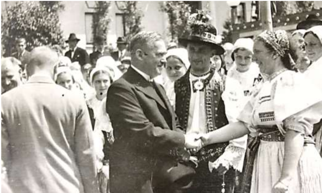
Obrázek 28: Přivítání zemského presidenta Jana Černého

Po prohlídce se konal společný oběd v jedné z výstavních restaurací 104 , na němž premiér Malypetr pronesl pár slov publikovaných také v místním tisku: