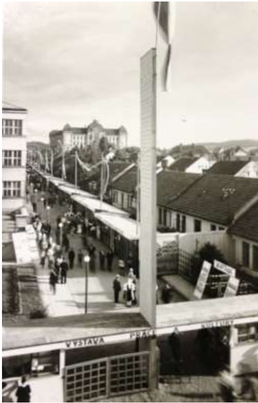
Obrázek 14: Vstupní hlavní brána