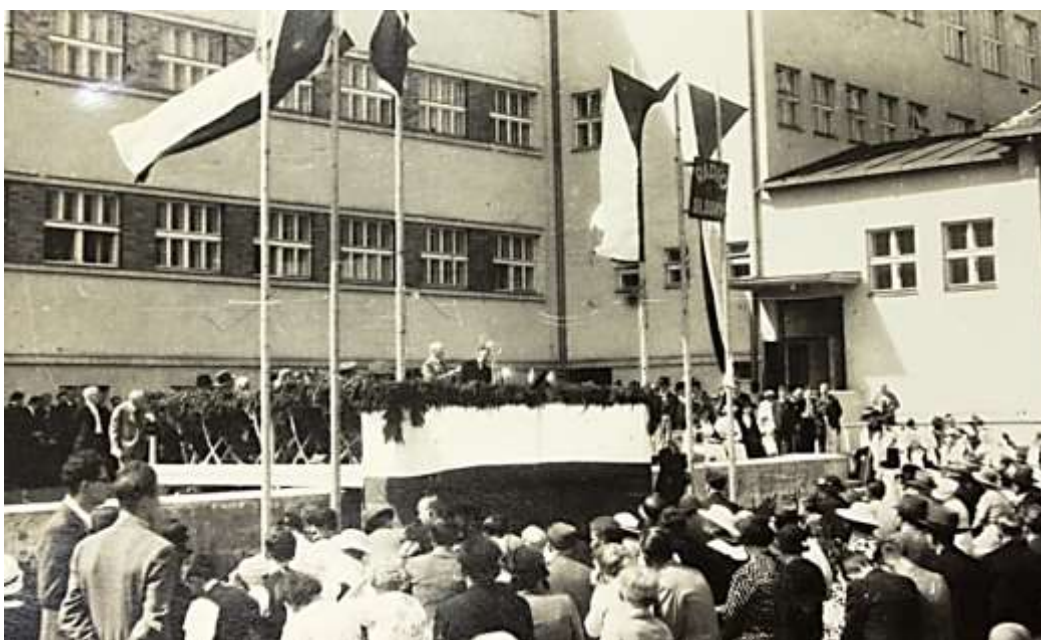
Obrázek 23: Slavnostní zahájení