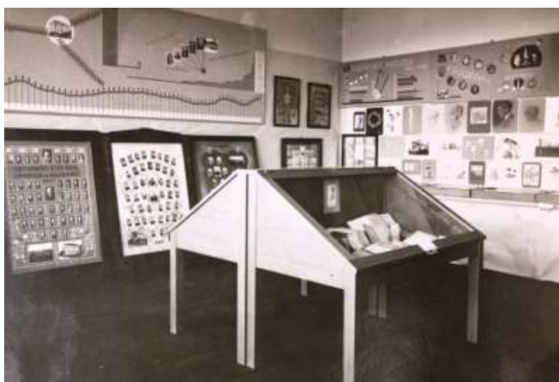
Obrázek 8: Školská výstava

Rozpočet odboru byl spočítán na 23 500 Kč, výdaje zahrnovaly výrobu vitrín, náklady na materiál a jeho dopravu a fotodokumentaci. V květnu byl dojednán výběr prací. Expozice byla umístěna do Zemského ústavu pro hluchoněmé, kde vyplnila 21 místností. Cílem bylo ukázat na vyspělost školství na Valašsku a poukázat na důležitost vzdělání. Instalace začala 17. 6., úkolem jednotlivých škol bylo samostatně si připravit vlastní koncepci expozice a předvést se před veřejností v co nejlepším světle. 62