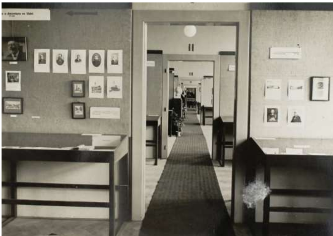
Obrázek 1: Výstava Masarykova díla

Název byl později upraven a dále se užívalo termínu 550leté výročí.