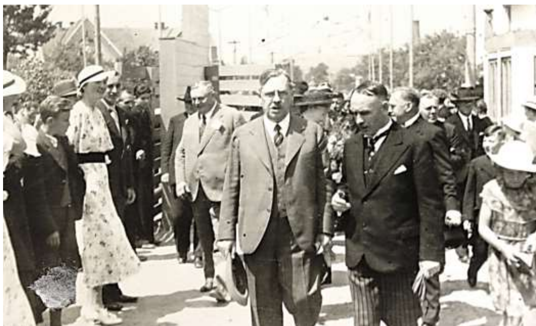
Obrázek 26: Premiér Malypetr při prohlídce výstavy

První den navštívil výstavu ministerský předseda Jan Malypetr. Přijel za doprovodu manželky o tři hodiny dříve, než bylo plánováno. Za výstavní výbor premiéra uvítali