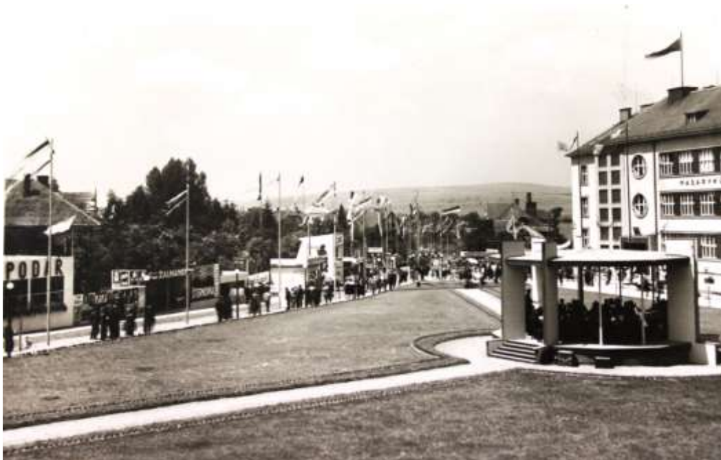
Obrázek 12: Areál výstavy