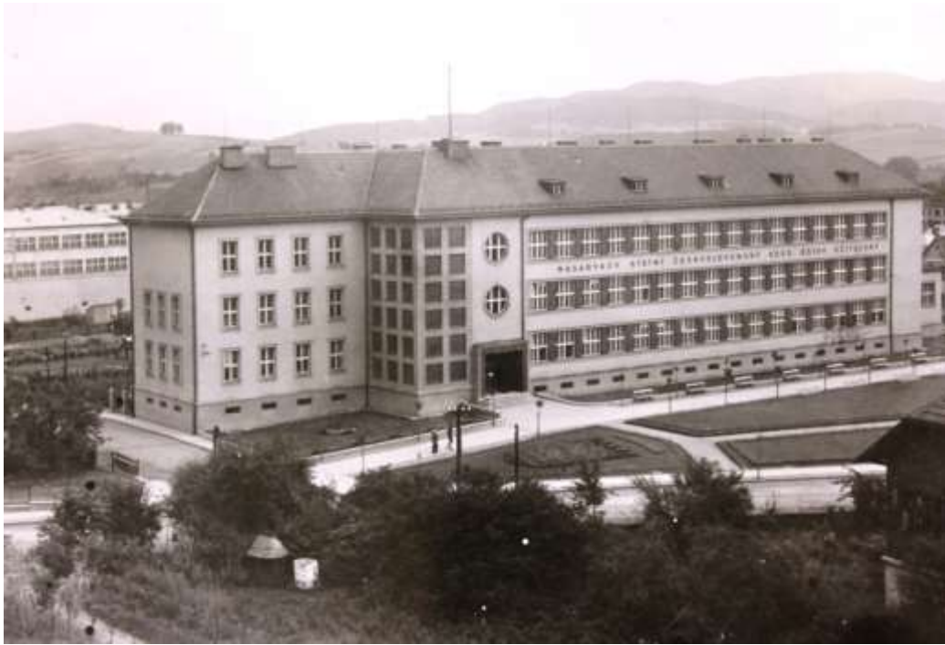
Obrázek 11: Masarykův státní československý koedukační ústav učitel'ský