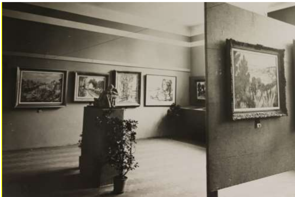
Obrázek 4: Výstava výtvarného umění

hosté, ale také příbuzní již nežijících malířů, kteří vlastnili zajímavá výtvarná díla. Ti byli žádáni o zapůjčení děl, která zůstala v pozůstalosti jejich rodin. Na výstavu byly připozvány spolky Jednota umělců výtvarných, 42 Spolek výtvarných umělců Mánes, 43 výtvarný odbor Umělecké besedy. 44