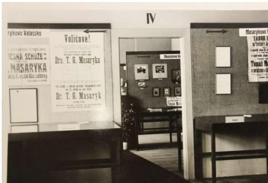
Obrázek 2: expozice Masaryk a Valašsko