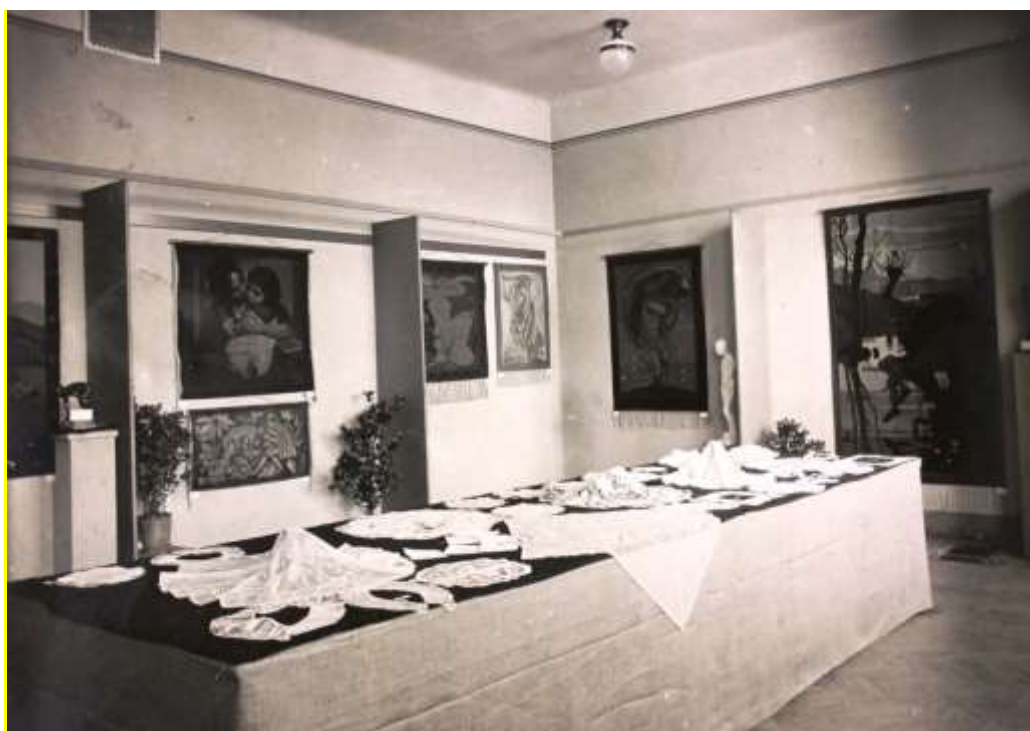
Obrázek 6: Místnost s gobelíny zdejší gobelínové školy

Rozpočet odboru byl spočítán na 15 500 Kč. Zahrnoval instalaci obou částí výstavy, katalog a odměny pro navrhovatele plakátů. Byl však později různě upravován.