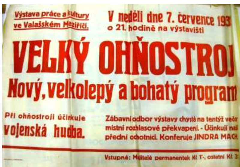
Obrázek 30: Plakát ze dne 7. července 1935.

Dne 7. července se konal sjezd Československých válečných poškozenců a invalidů. Proběhla sportovní manifestace a sociální demokracie pořádala Den strany. Večer ve 21.00 hod. se na výstavišti uskutečnil velký ohňostroj pořádaný za doprovodu vojenské hudby. 110 Zábavní odbor připravil jako překvapení rozhlasové vystoupení místních ochotníků. 111