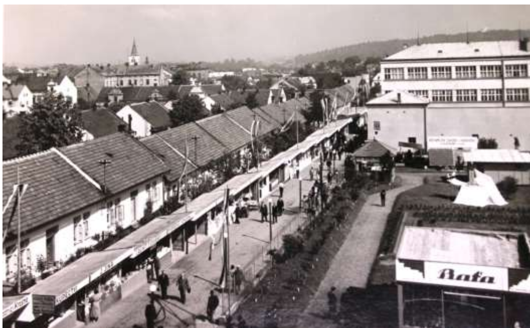
Obrázek 17: Areál s polokrytými stánky a Baťovým pavilonem

Před těmito stánky byla umístěna ještě expozice hřbitovního umění. Vystaveny byly kříže, náhrobní kameny, sochy, pomníky a také dřevěná stavba valašské kaple. 77