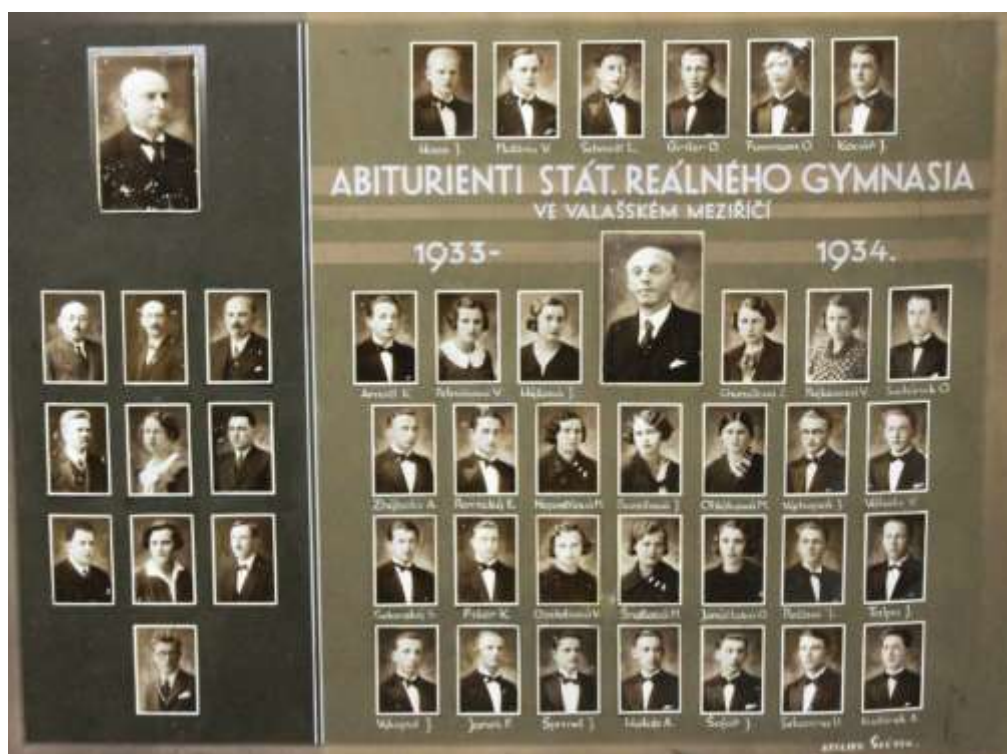
Obrázek 9: Tablo gymnázia 1933-1934