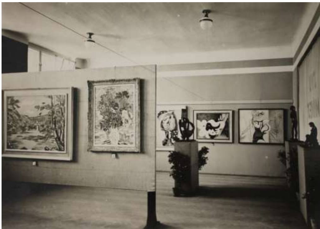
Obrázek 5: Moderní umění na výstavě