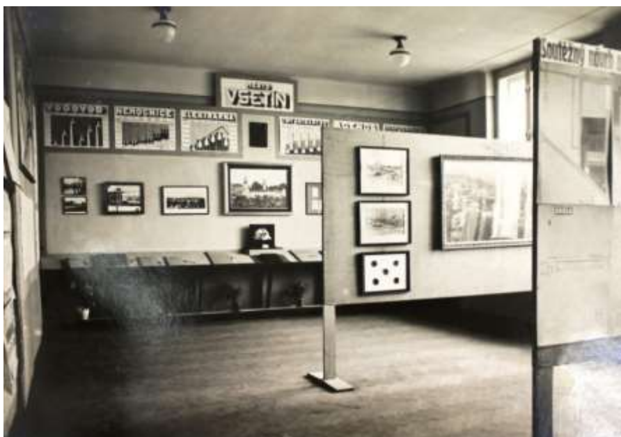
Obrázek 15: Výstava města Vsetín