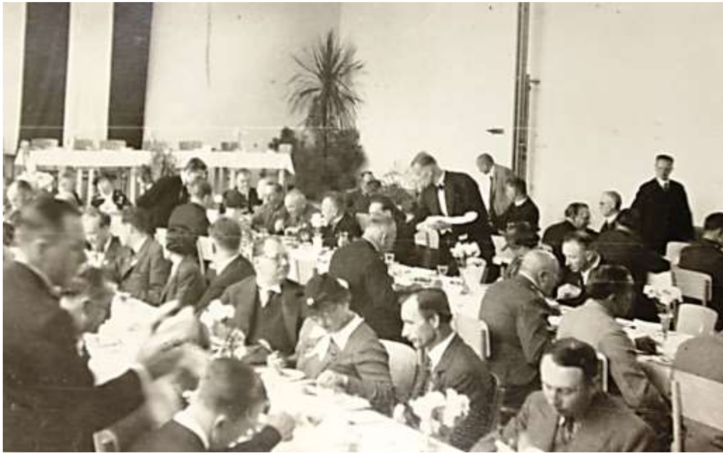
Obrázek 29: Slavnostní oběd v restauračním zařízení areálu

Od 16.00 hod. se v areálu výstaviště konal také vůbec první sjezd politické strany, a to Československé strany lidové. Lidovci zorganizovali průvod z Krásna, který následoval o chvíli později po průvodu Valaško-slovenských národopisných slavností. Večer ve 20.00 hod. se podruhé hrála opera Prodaná nevěsta , tentokrát v Lidovém domě.