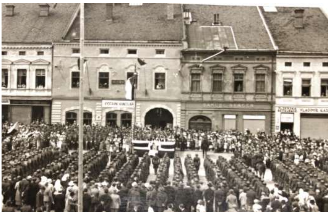
Obrázek31: Přehlídka 40. pěšího pluku