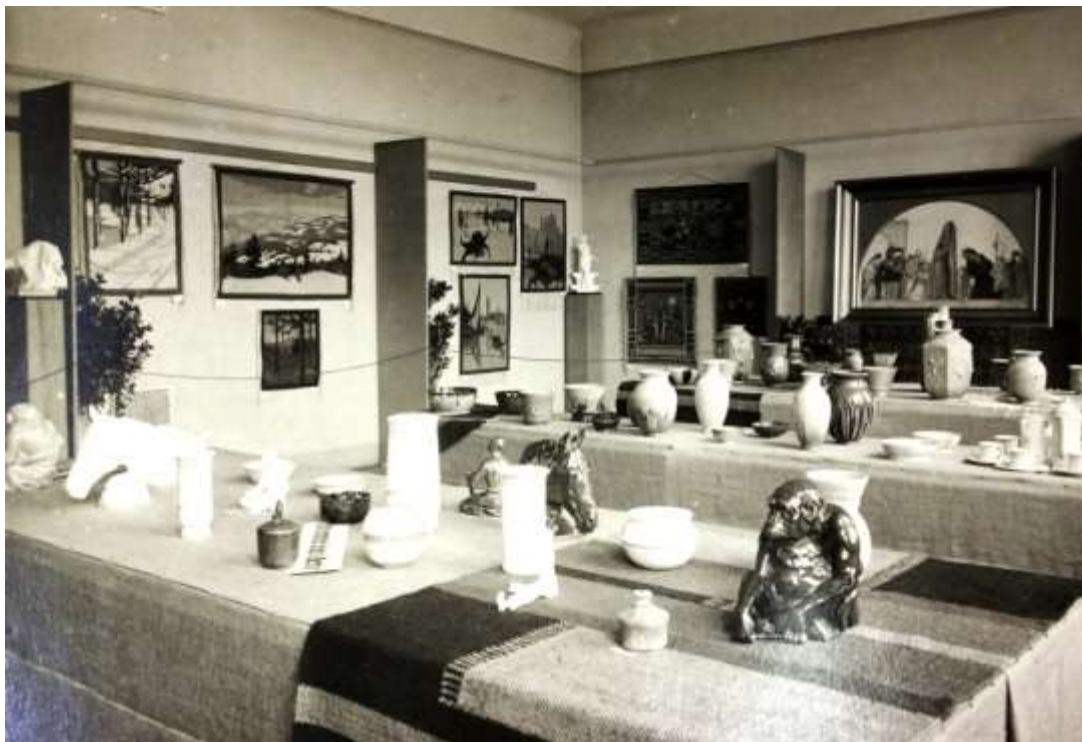
Obrázek 7: Užité umění na výstavě

Bylo rozhodnuto, že tato část expozice bude umístěna v osmi místnostech přízemí a prvního i druhého patra Státní odborné školy pro zpracování dřeva. 53 Obrazárna byla instalována v druhém patře, užité umění v přízemí a prvním patře. Spolku výtvarných umělců Mánes bylo umožněno pořádat přednášky v reprezentačním sále odborné školy, ačkoliv pořadatelé chtěli původně vytvořit přednáškový prostor v tělocvičně učitelského ústavu. 54