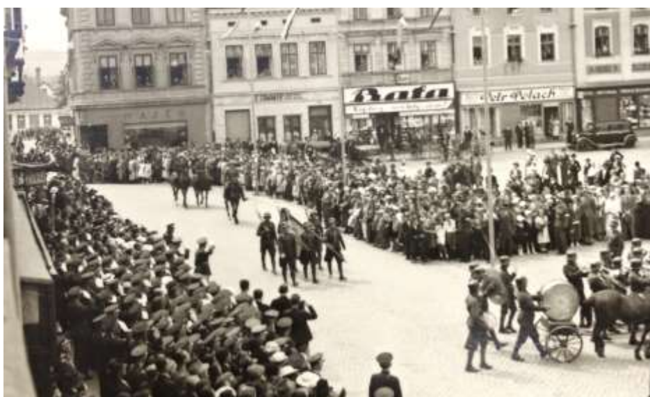
Obrázek32: Průvod 40. pěšího pluku

O víkendech bývalo díky výstavě ve Valašském Meziříčí opravdu rušno, například v již zmíněnou neděli 14. července se kromě vojenských slavností a sportovních utkání ve městě konal ještě den národních socialistů 115 a sjezd zemských včelařských spolků. 116