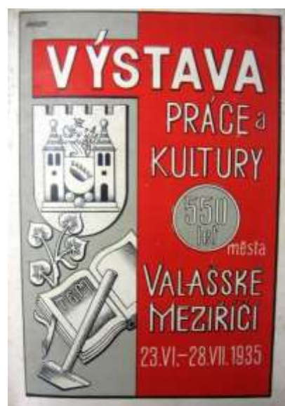
Obrázek 3: Titulní strana katalogu výstavy