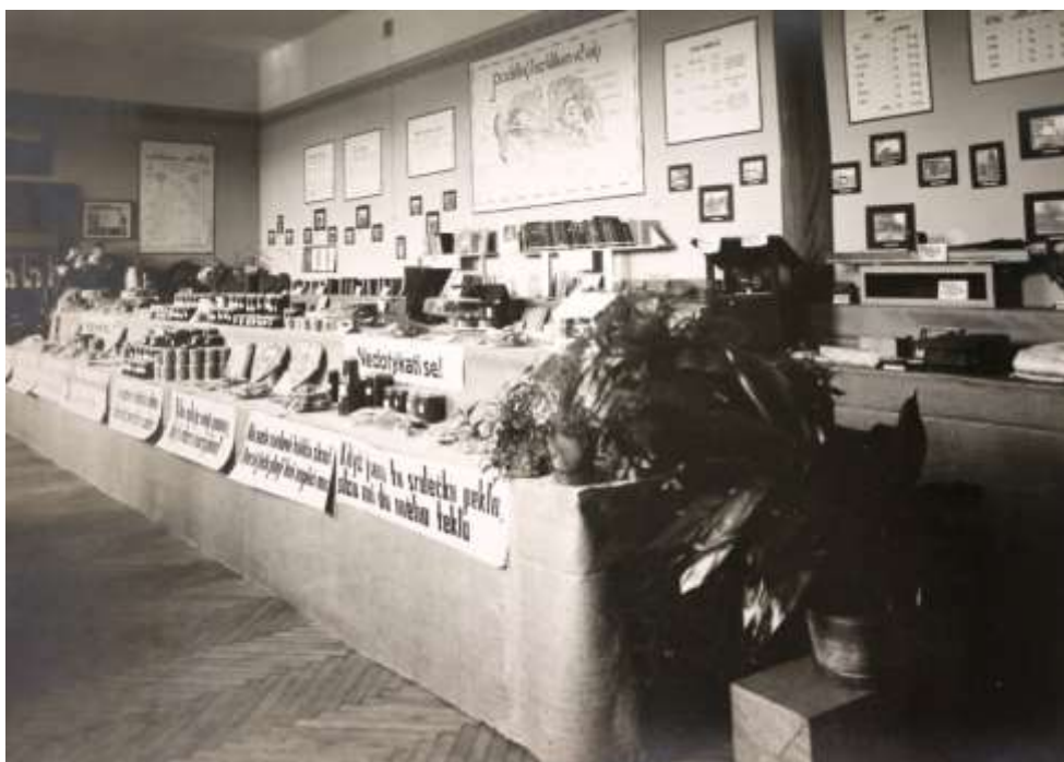
Obrázek 18: Výstava včelařů

K poslední výstavní budově vedla cesta rozsáhlým parkem se zahradní restaurací. Ve večerních hodinách byla budova Zemského ústavu pro výchovu hluchoněmých krásně nasvětlená, stejně tak i učitelský ústav. V zahradě před budovou byl vystaven skleněný včelí úl, ve kterém mohli návštěvníci pozorovat práci včelstva a jež byl součástí venkovní části včelařské výstavy. 87