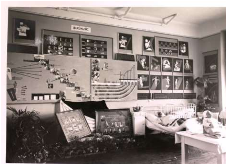
Obrázek 16: Výstava města Valašské Meziříčí

První budovou, kterou si mohl návštěvník prohlédnout, byla Státní odborná škola pro zpracování dřeva s informativním označením Oddělení bytové kultury, uměleckého průmyslu a výtvarného umění. V této budově byla také vytvořena expozice valašských měst. 73