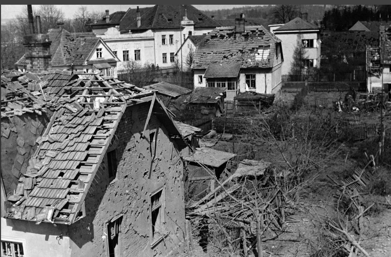
Pohled z patra Dadákovy továrny na poničené domy a na budovu Sokolovny, u které byla pouze lehce poškozena střecha.