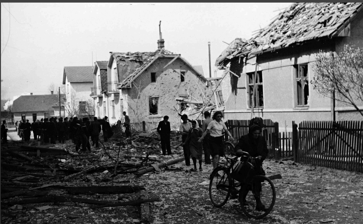
Ulice Palackého krátce po bombardování, kde bylo hlavní centrum zásahu.

Ve středu 11. dubna 1945 ve 13:20 zaútočila letadla 1. bombardovací skupiny Rumunského královského letectva na železniční infrastrukturu ve Valašském Meziříčí. Cílem bylo nádraží a železniční tratě v dnešním Krásně nad Bečvou, kde se nacházely cisterny s palivem pro Wehrmacht. Během náletu bylo shozeno množství bomb, které zasáhly oblast Krhové, Obory a nádraží. Nad Dadákovou pražírnu kávy se letadla stočila směrem k východu, kde bombardování pokračovalo na Palackého a Husově ulici, budova gymnázia zasažena nebyla.